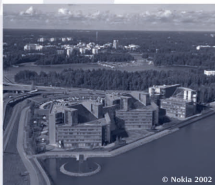
Le siège social de Nokia à Espoo